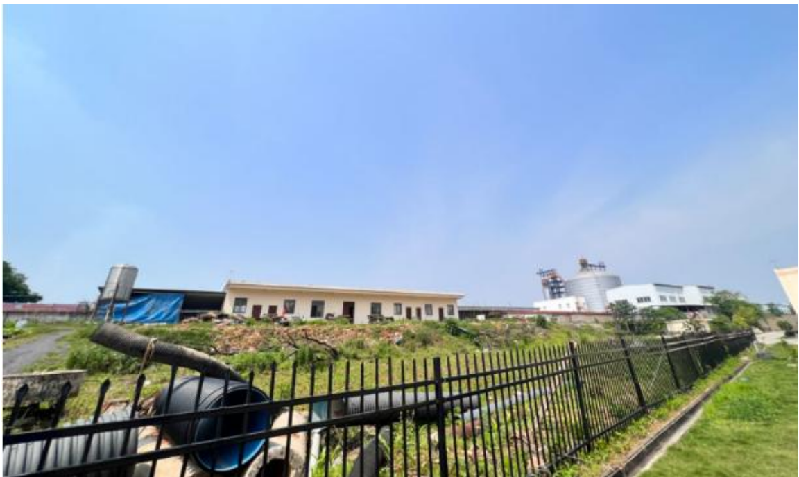
西南侧为安庆市华城硫磺有限公司、西北侧为菁彩新材料(安徽)有 限公司复合肥厂(生产车间内设备已全部拆除, 厂房闲置)及茅清路