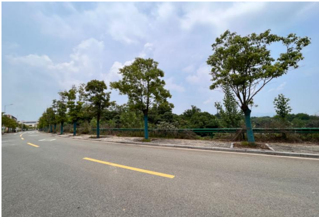
东南侧为樟冲路、一条埋地输油管道及防护绿地