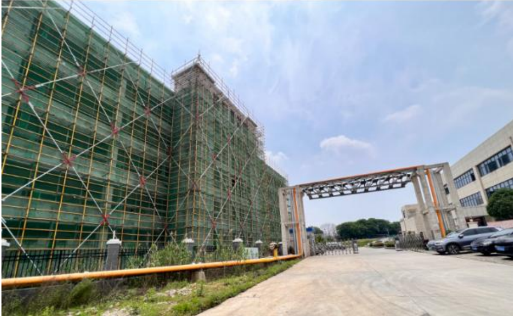
东南侧为大使涂料（安徽）有限公司年产 6 万吨科技型、水性环保涂料 项目在建综合楼