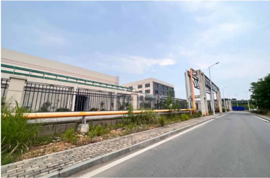
西北侧安庆凯锐化工有限公司