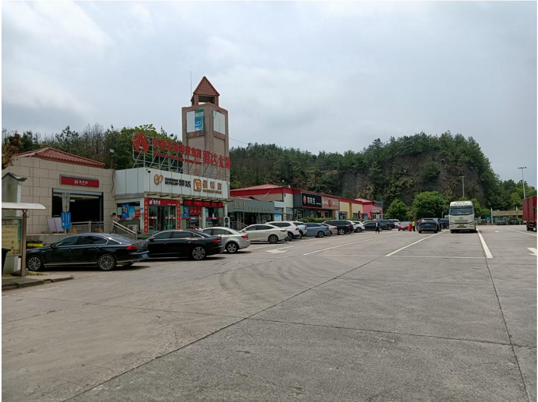
建西侧太湖服务区综合楼（二类保护物）、服务区停车场（三类保护物）