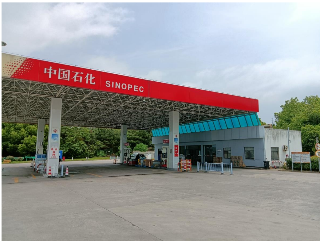
太湖服务区加油南站正面照片