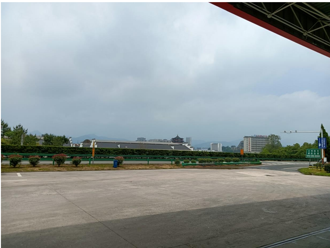
建北侧为 G50 沪渝高速公路