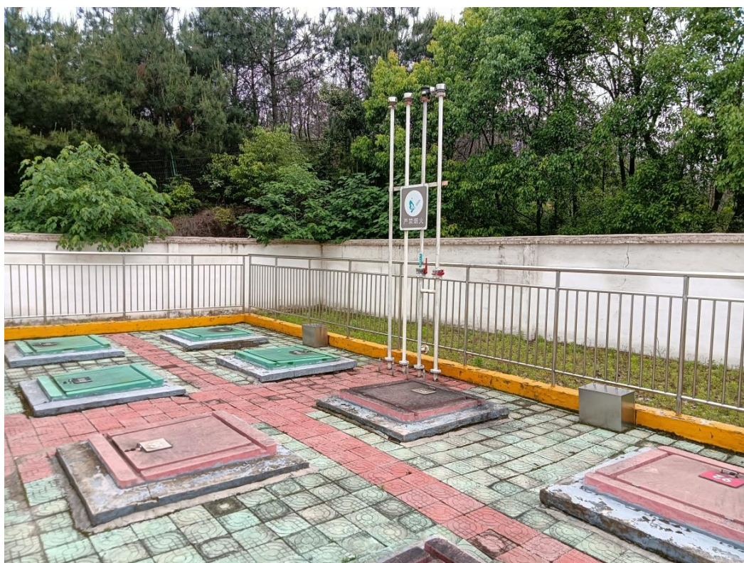
太湖服务区加油南站罐区照片