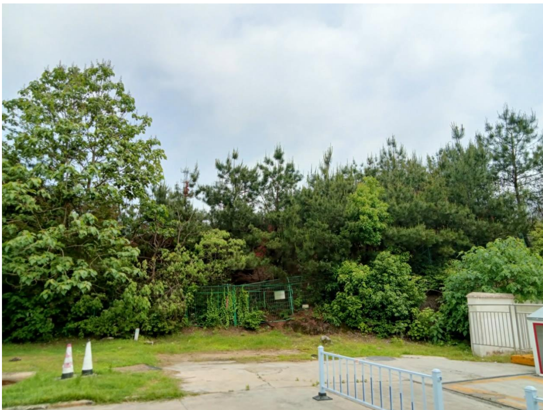
太湖服务区加油南站建东侧为树林