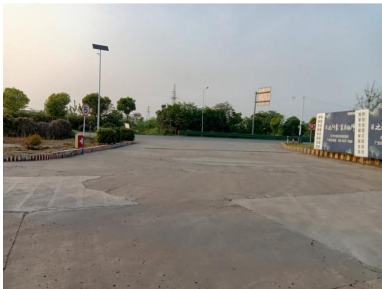
图 1 西北侧 G347 国道（原 S319 省道）