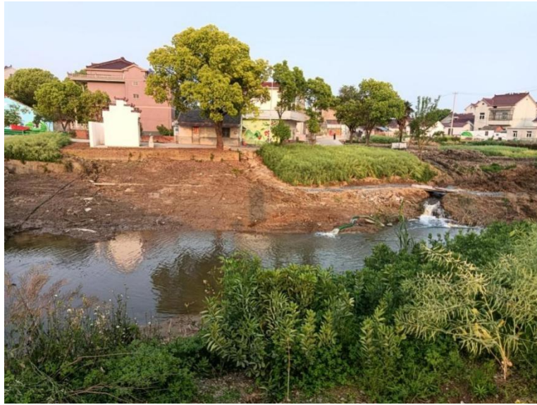
图4 东侧围墙外居民区