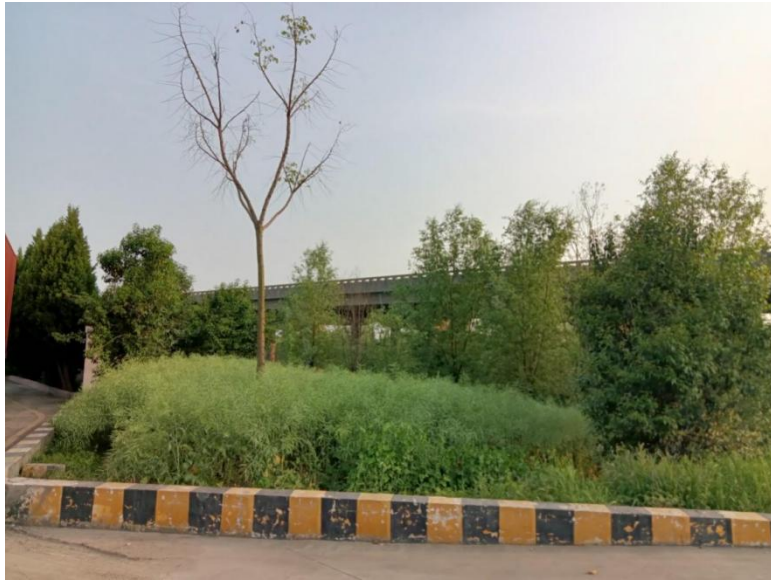
图3 西南侧铜商高速