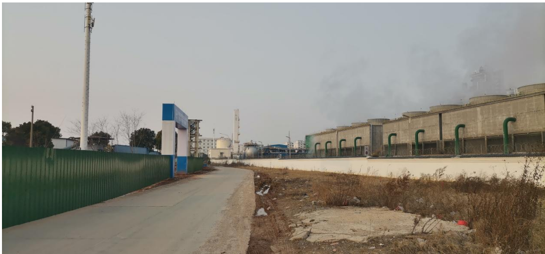
厂区西侧：园区丹桂路