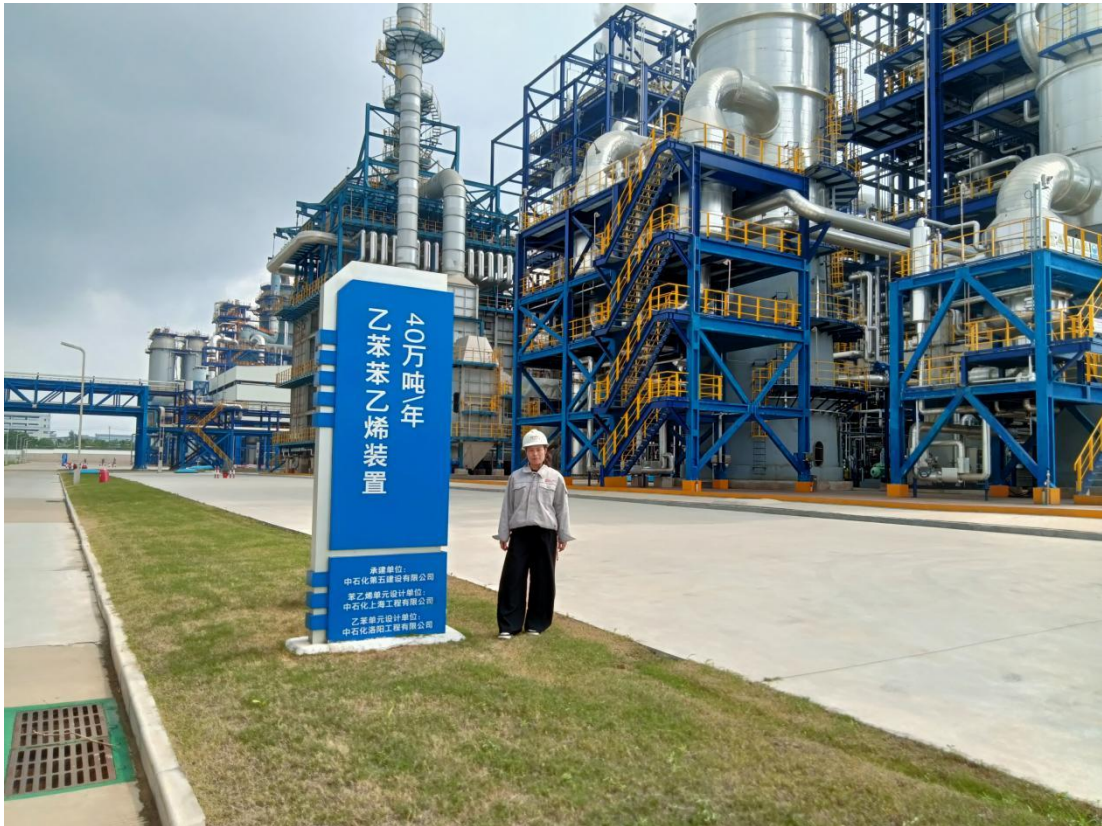
安庆百聚化工新材料有限公司危险化学品重大危险源安全评估影像资料（AX2024024）