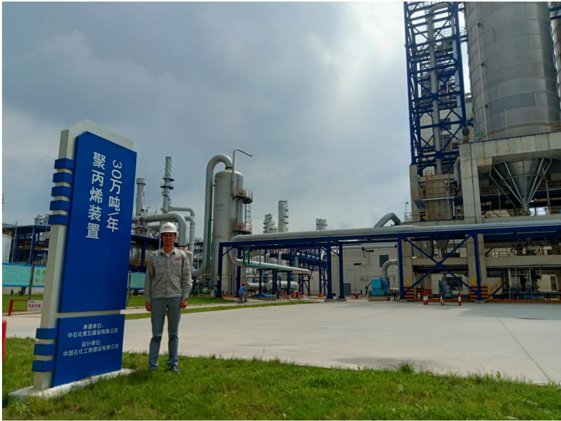
项目现场勘查人员