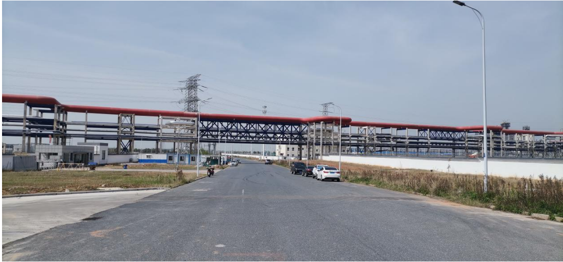
厂区东南侧：园区纬九路