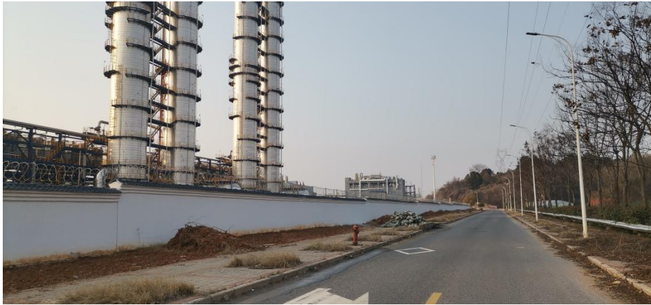
厂区东侧：园区黄土坑西路及木荷路