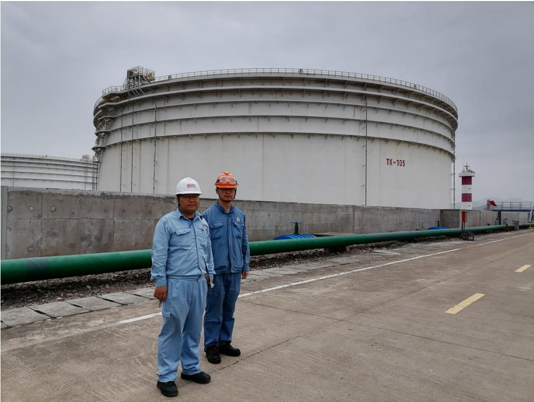
现场勘察照片 2（2023 年 7 月 8 日现场问题复查）