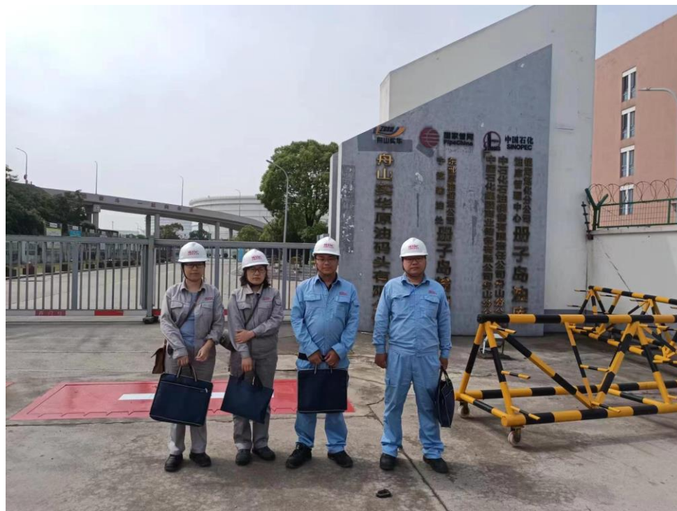
现场勘察照片 1（2023 年 5 月 25 日首次现场勘察）