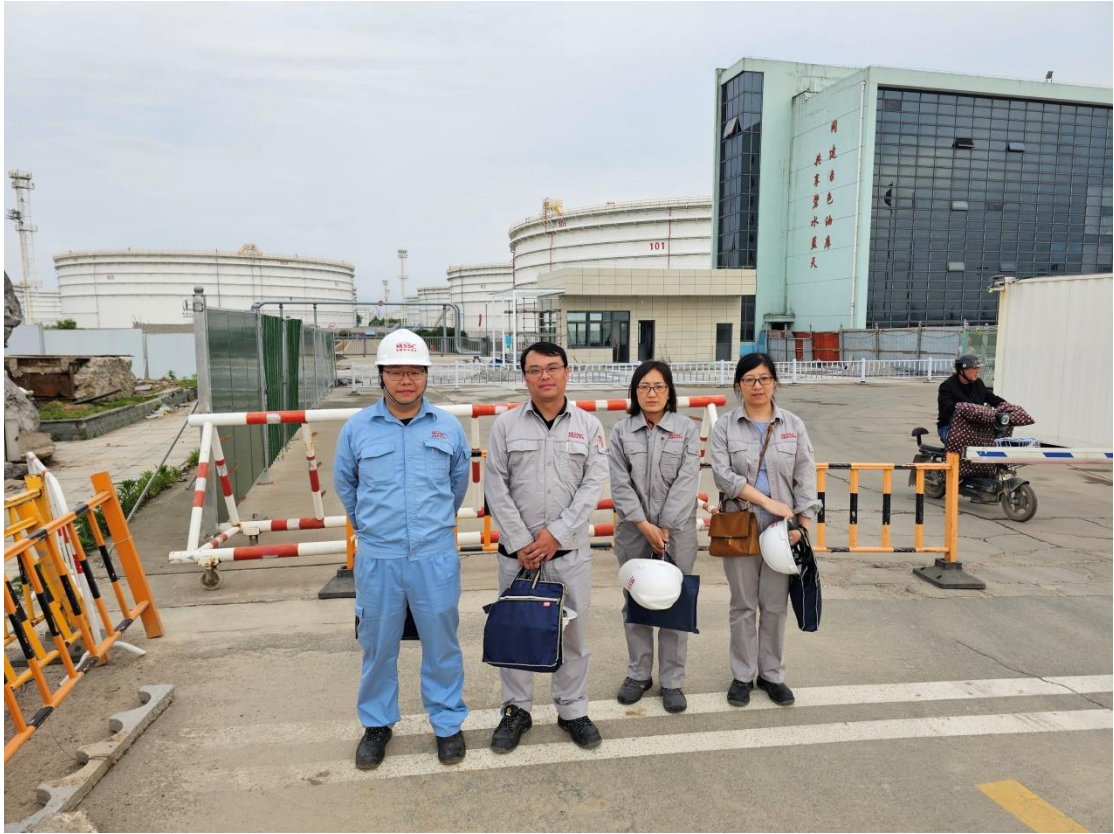
项目组成员现场勘查照 1