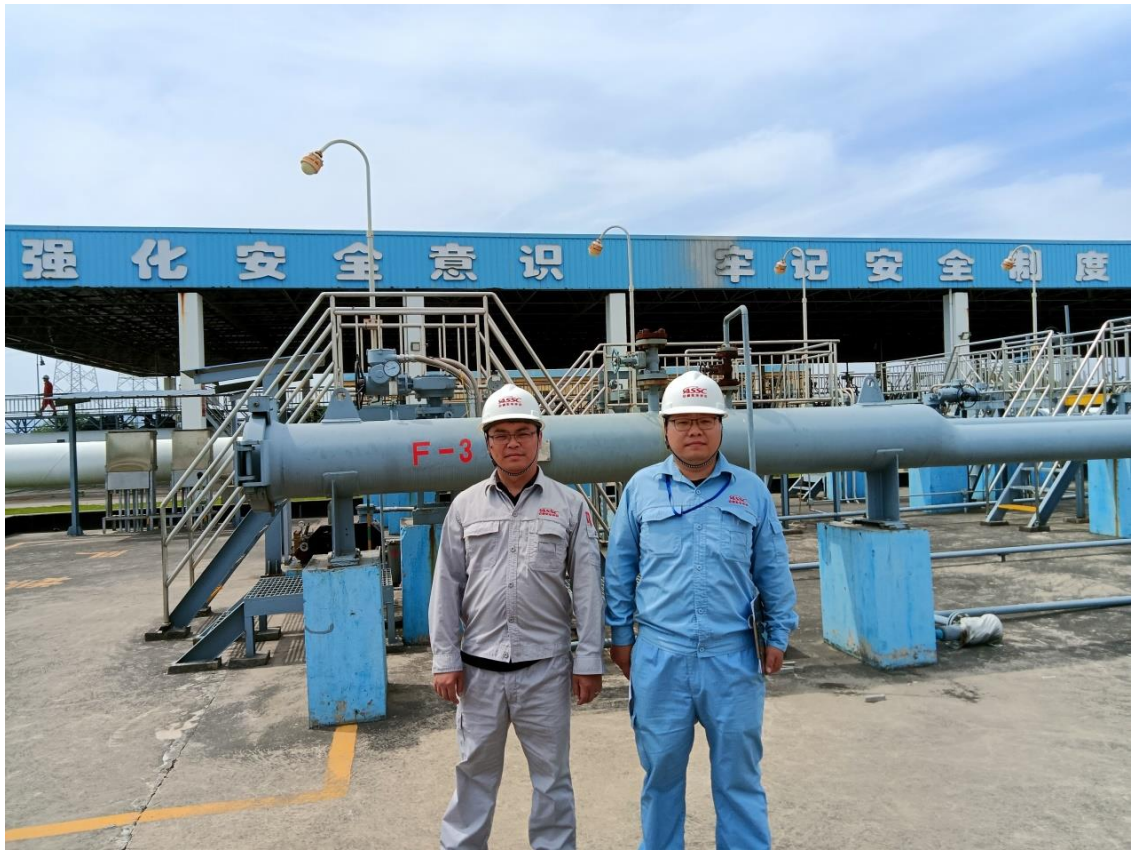
项目组成员现场勘查照 3