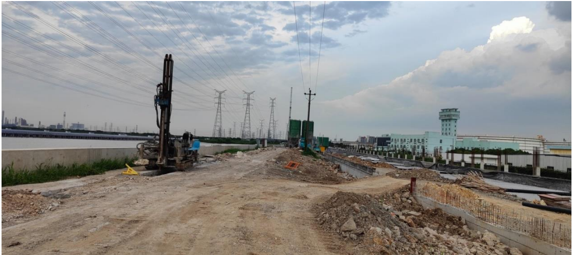
库区西北侧岚山水库及在建的明海大道