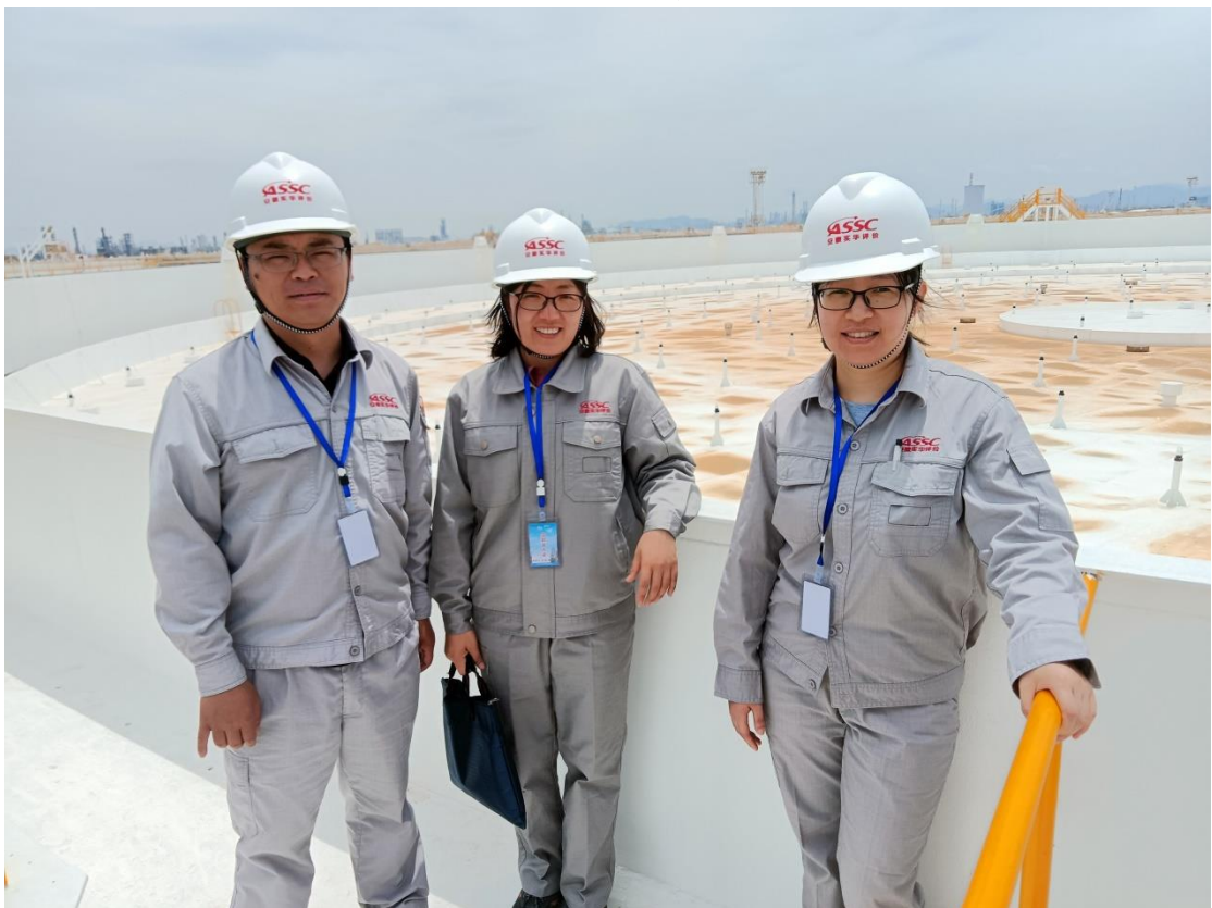
项目组成员现场勘查照 4