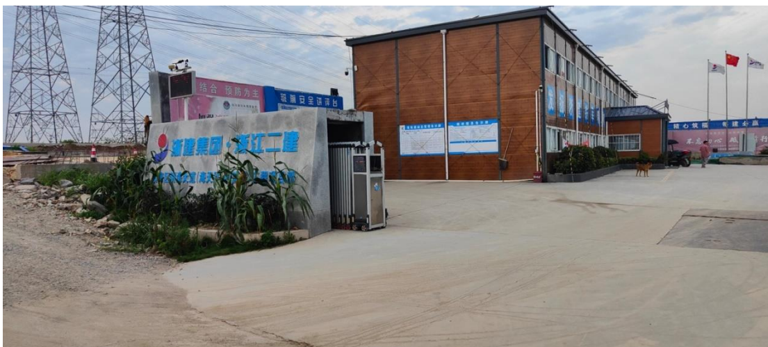
库区西侧光伏电站及明海大道工程项目部