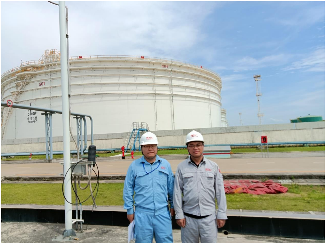
项目组成员现场勘查照 2