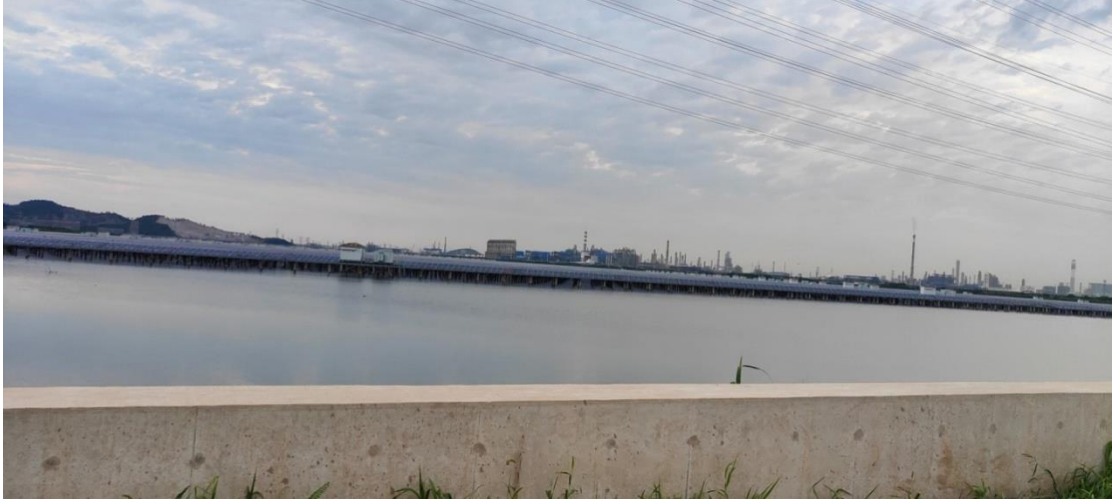
库区西北侧岚山水库