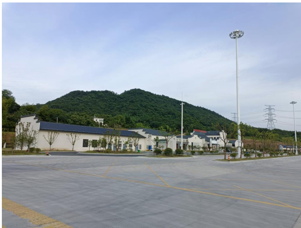
站区东南侧服务区综合楼