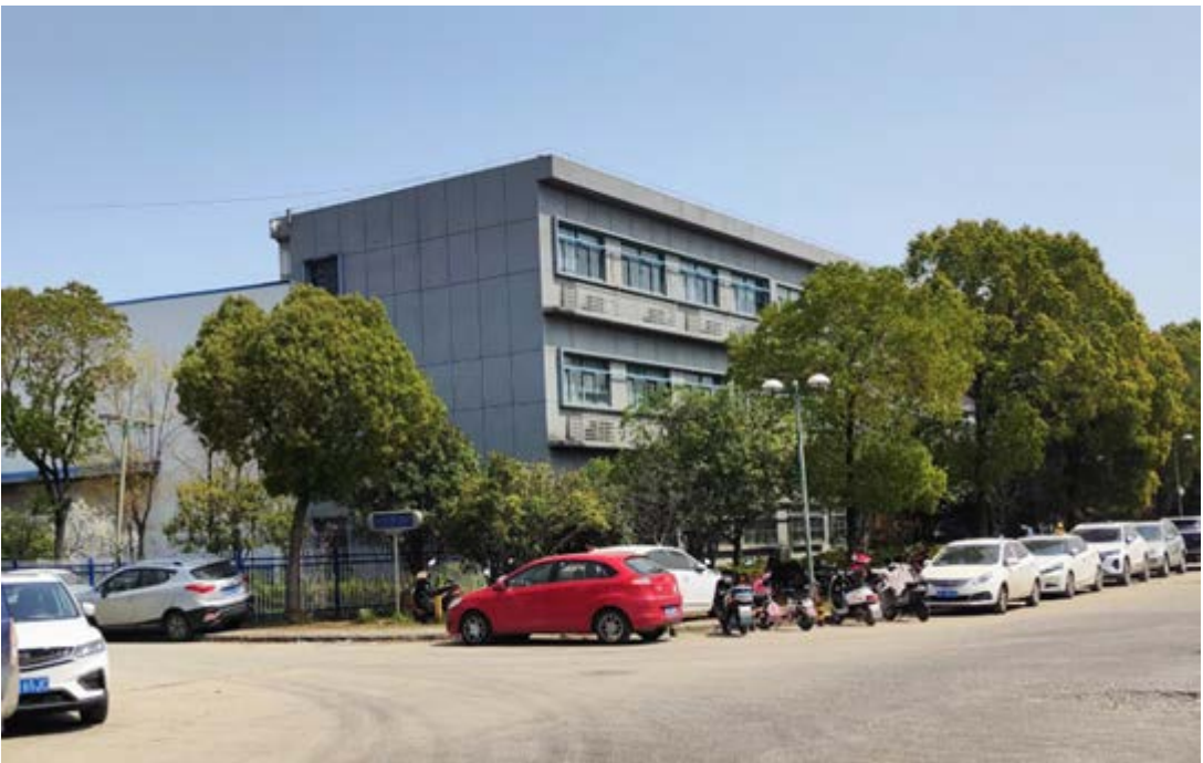
北侧合肥淞仁汽车科技有限公司和巨一公司合属区域