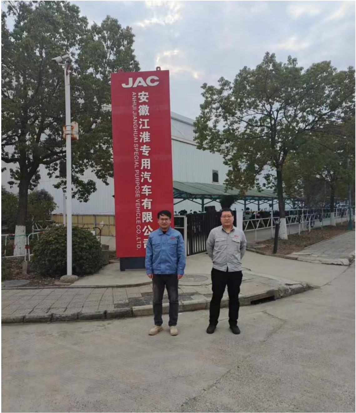
项目负责人勘察现场