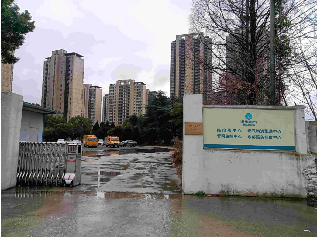
图一东南面港华燃气公司管道运行维护抢险中心