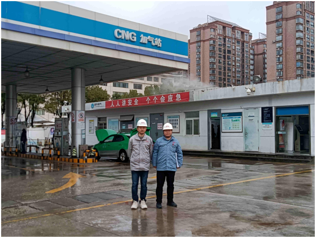
图六 现场勘察人员