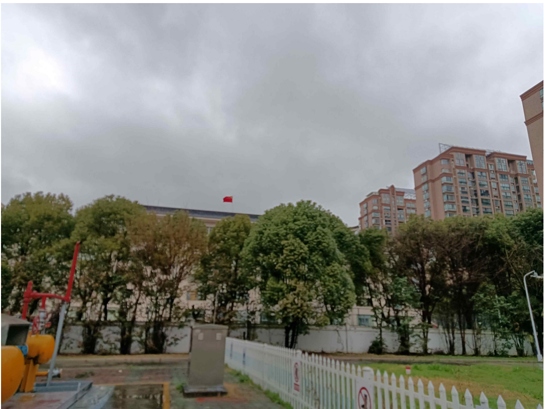
图四 正北面为市环保局大楼