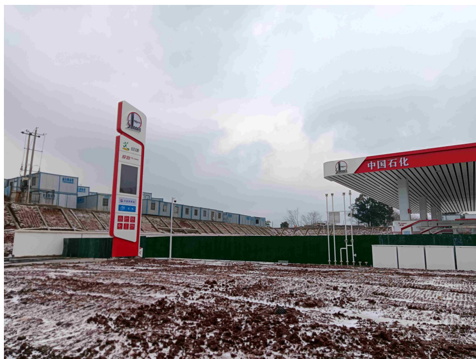
图二 LNG 调峰站-南部加油站