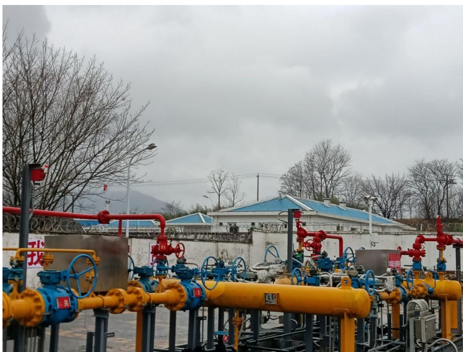
西侧为省天然气公司分输站办公楼