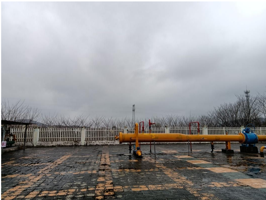
东侧为民居、架空电力线、信号塔