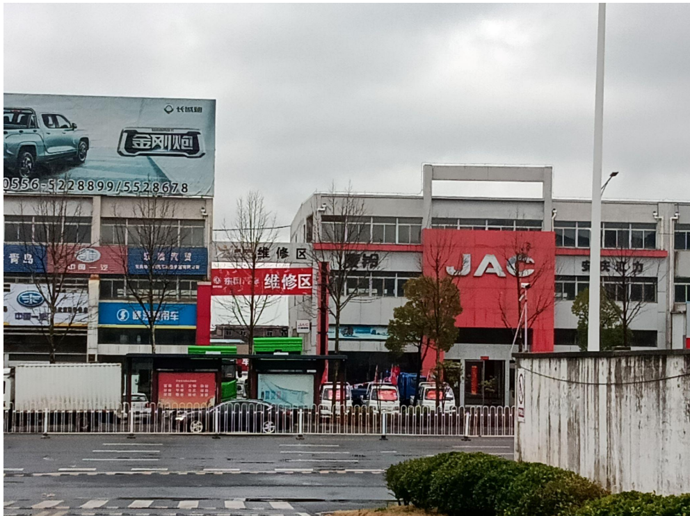
南侧为中山大道、汽贸商城