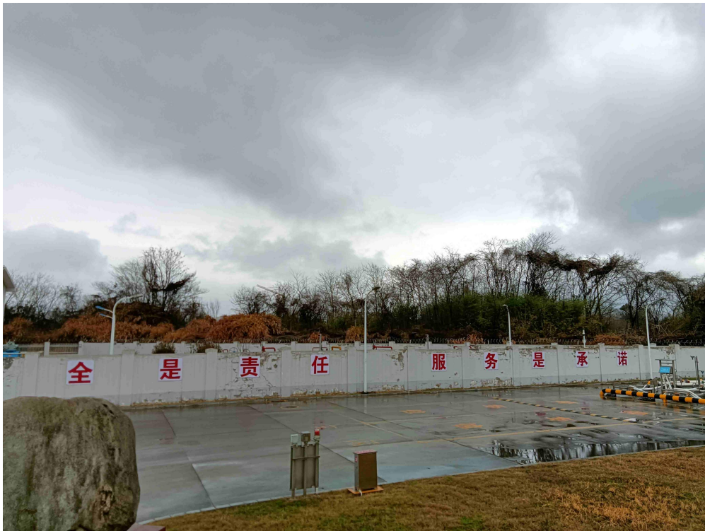
图四 LNG 调峰站-北部空地