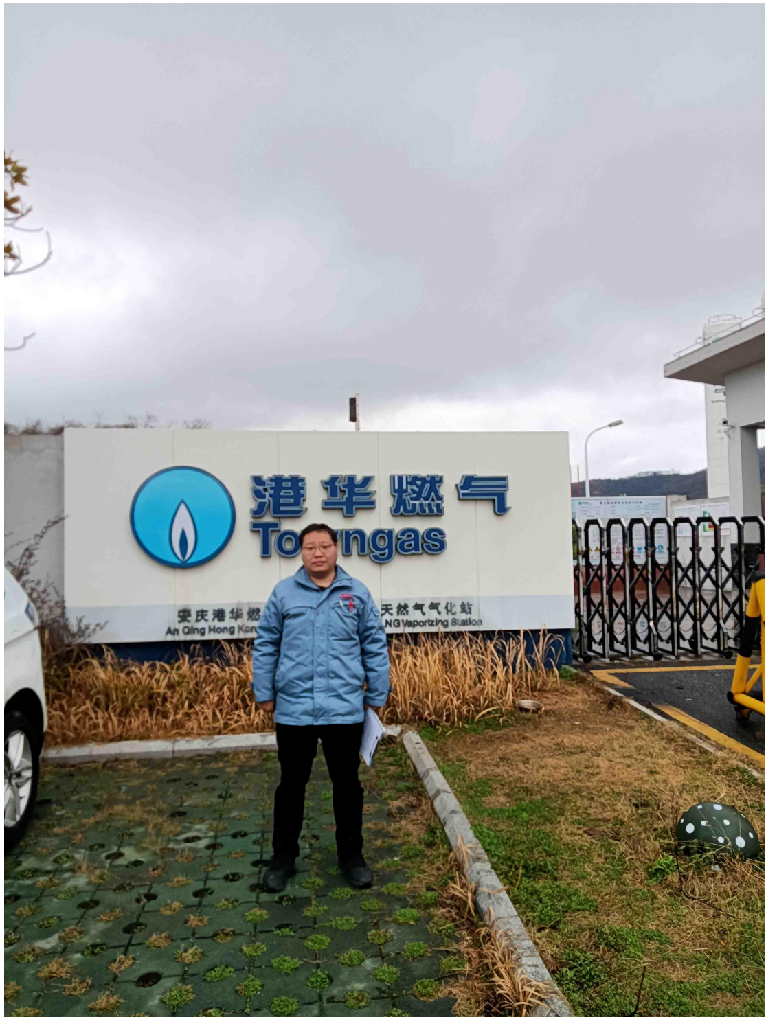
图五 LNG 调峰站-现场勘察人员