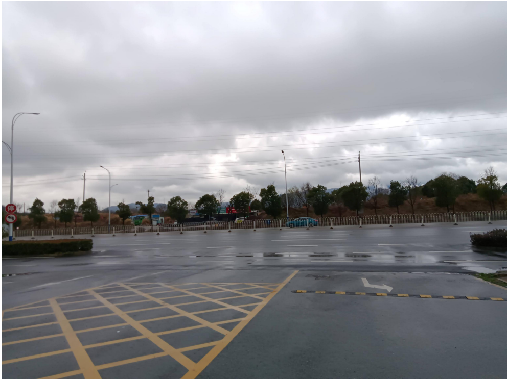
图三 LNG 调峰站-西部环城西路