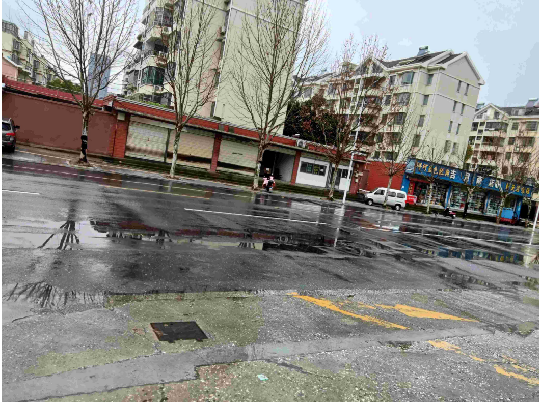
图三西部港华路、商业店面