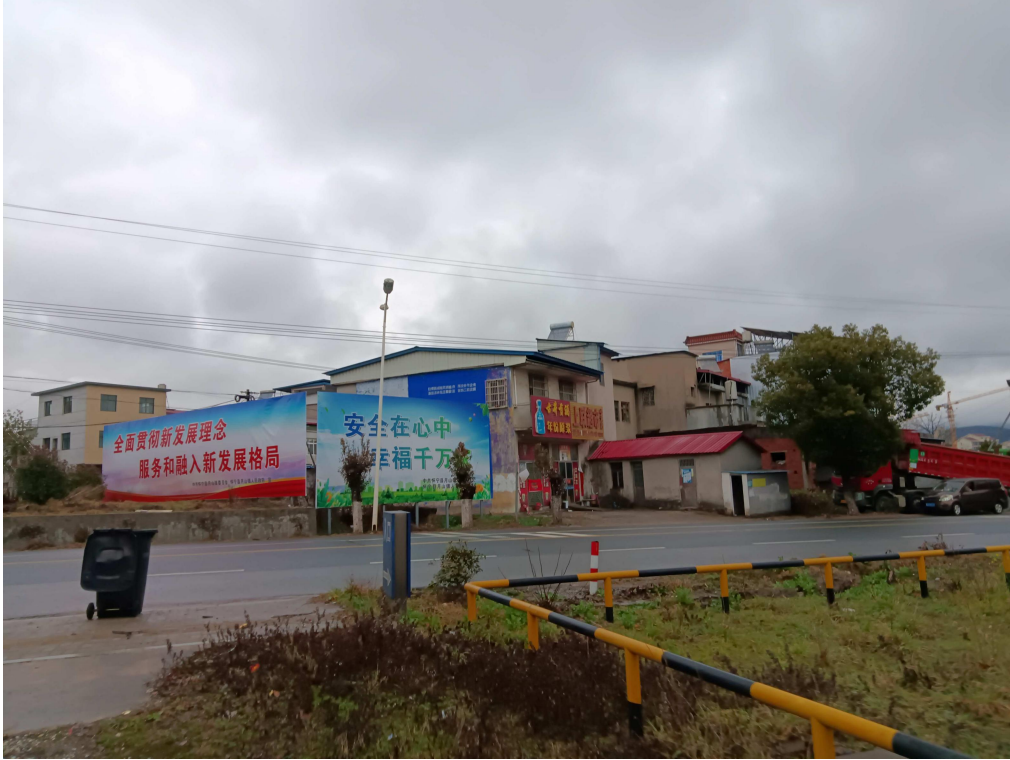
北侧为 318 国道