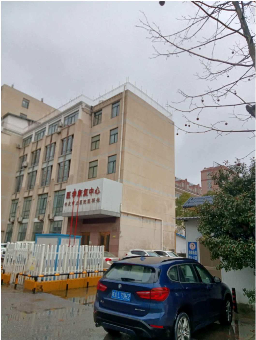
图五 西北面为博爱医院