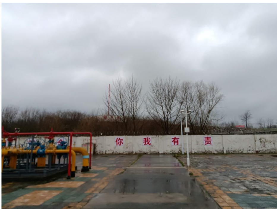
南侧为省天然气公司分输站放散管