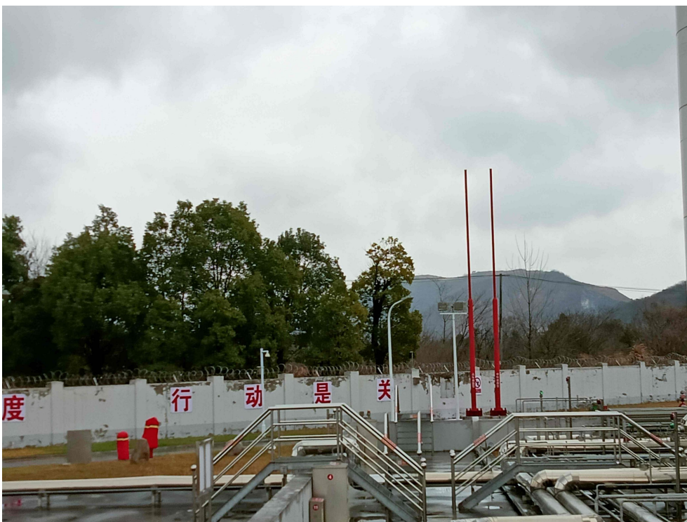
图一 LNG 调峰站-东部空地